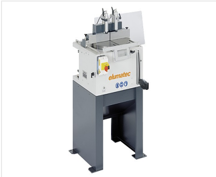
Sierra de mesa TS 161/21