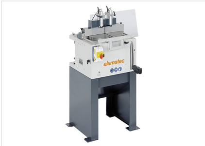
Sierra de mesa TS 161/21