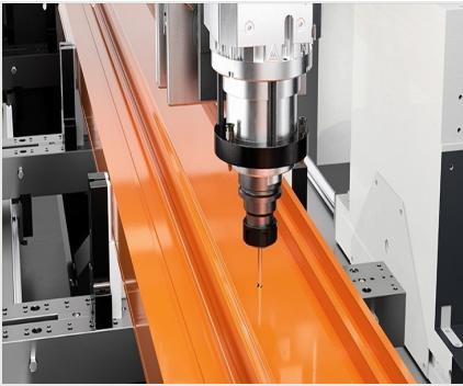
Centro de mecanizado de barras SBZ 141