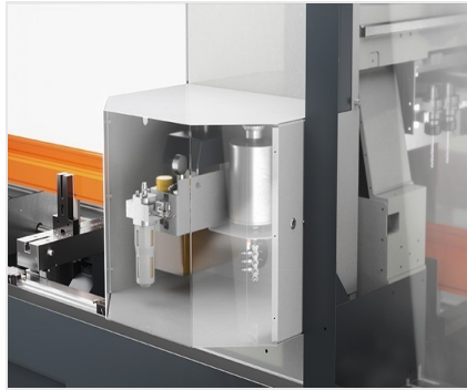
Centro de mecanizado de barras SBZ 141