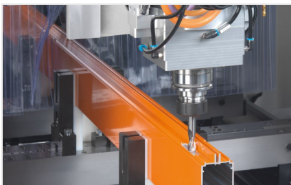
SBZ 140 Centro de mecanizado de barras