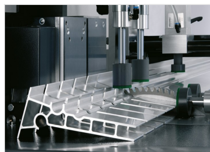
Tronzadora automática SAS 142/44