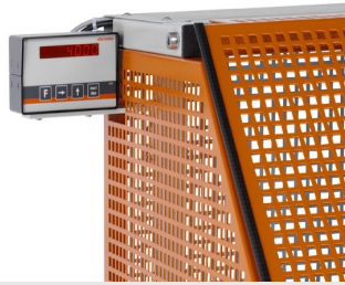
Tronzadora automática SA 73/36