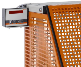
Tronzadora automática SA 73/36