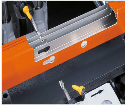
Copiadora fresadora triple KF 178/10