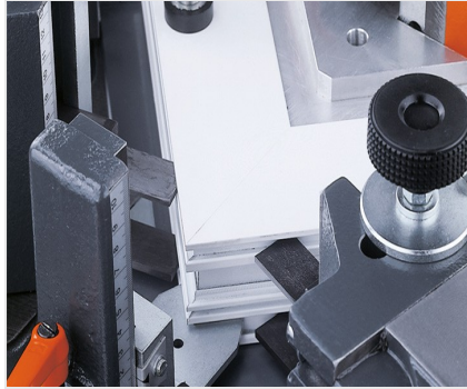
Ensambladora de esquinas EP 124