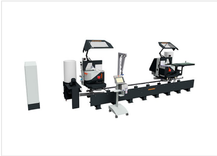
Tronzadora doble DG 104 + E 590