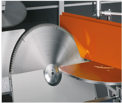
AKS 134/64 + accesorios especiales