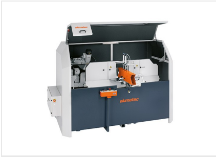
Tronzadora retestadora AKS 134/64