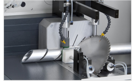
Sägearbeitzeug SAS 142/43