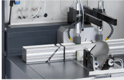
Sägearbeitzeug SAS 142/43