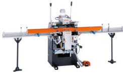
3-Spindel-Kopierfräse KF 178/10