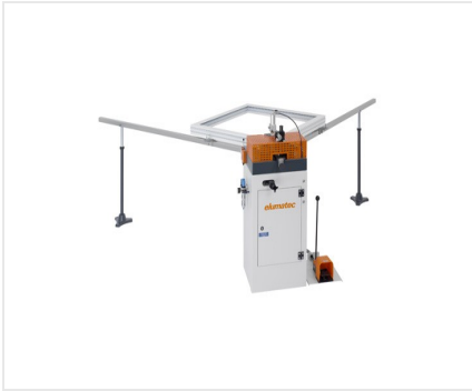
Eckverbindungspressen EP 120