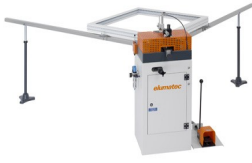
Eckverbindungspressen EP 120