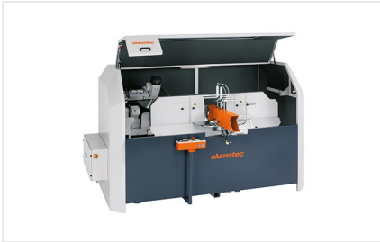
AKS 134/64 + Sonderzubehör