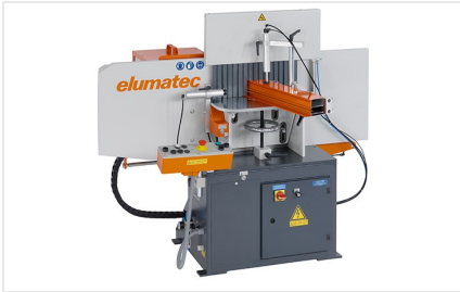
Auslinkfräse AF 223/01