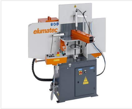
Auslinkfräse AF 223/01