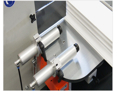
Auslinkfräse AF 222/02