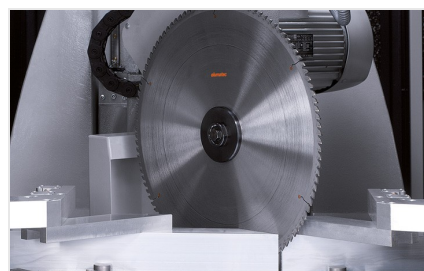
Centrum pro obrábění tyčí SBZ 631