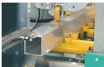
Centrum pro obrábění tyčí SBZ 631