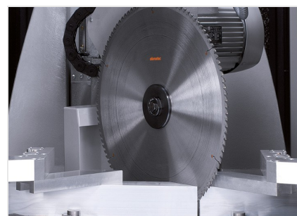
Centrum pro obrábění tyčí SBZ 631