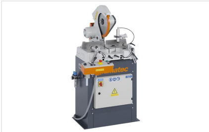
Pokosová pila MGS 73/33