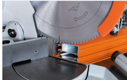
Pokosová pila MGS 73/33