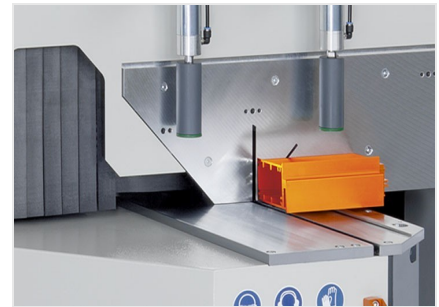
Pokosová pila MGS 105