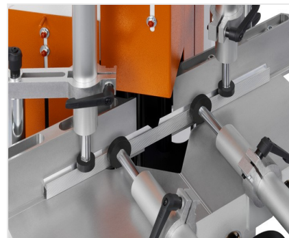
Klínová a vyřezávací pila KS 101/30