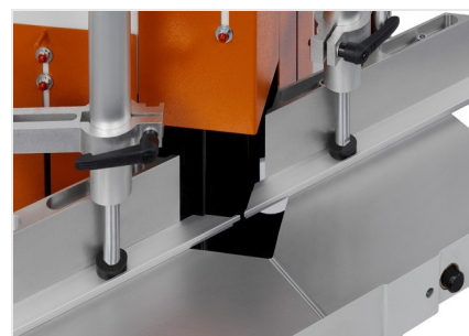
Klínová a vyřezávací pila KS 101/30