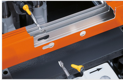
2vřetenová kopírovací fréza KF 78/23