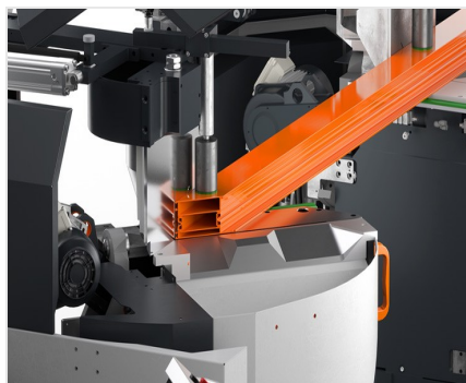
Dvoukotoučová pila DG 104