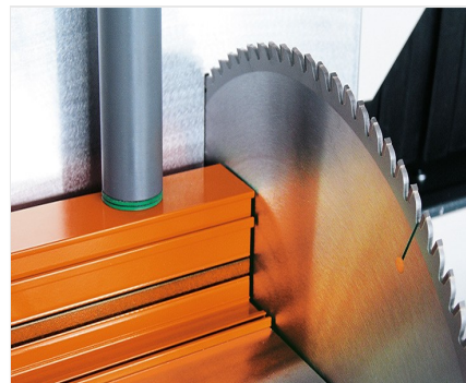
Dvoukotoučová pila DG 104