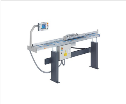
Dorazový a měřicí systém AMS 200 + E 355