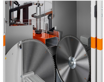
Vyřezávací pila AKS V-550