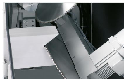
Vyřezávací pila AKS 134/64