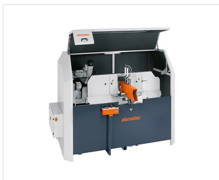
AKS 134/64 + zvláštní příslušenství