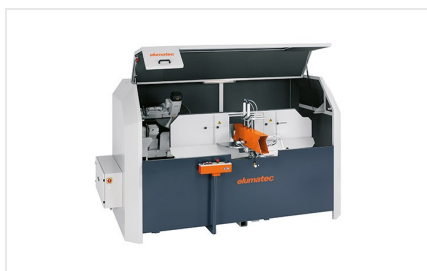
AKS 134/64 + zvláštní příslušenství