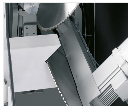
Vyřezávací pila AKS 134/64