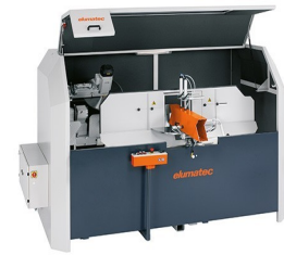
AKS 134/64 + zvláštní příslušenství