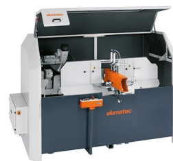
AKS 134/64 + zvláštní příslušenství