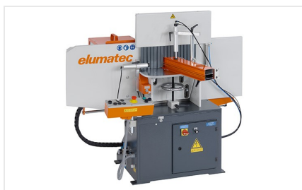
Čelní fréza AF 223/01