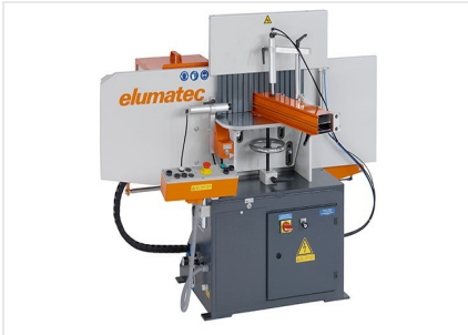
Čelní fréza AF 223/01